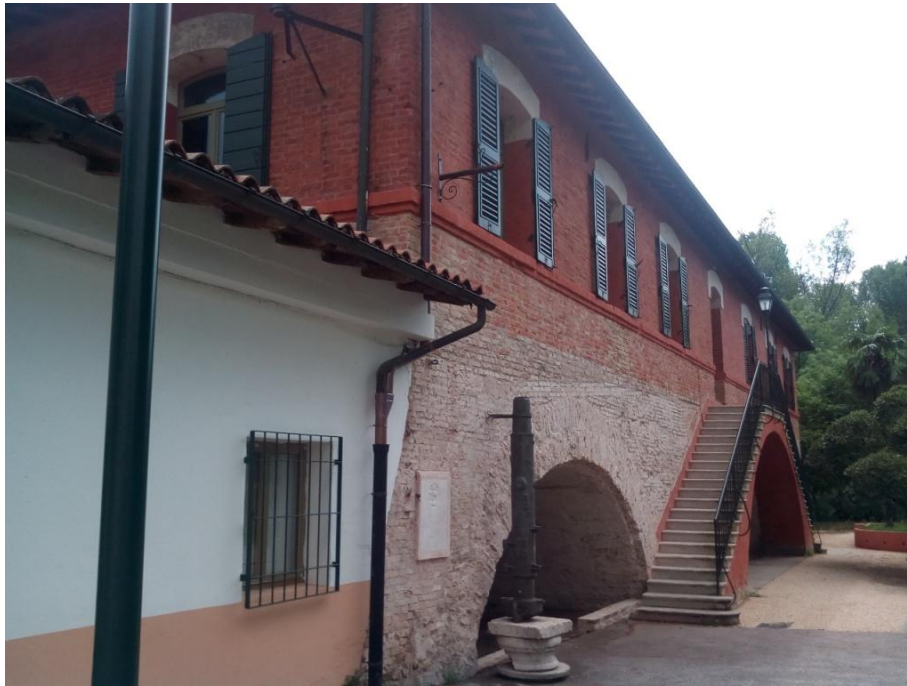
Quello murato è il cippo n° 71

Se guardiamo sulla facciata ovest a circa un metro e trenta di altezza vediamo murato sulla parete uno dei cento cippi di conterminazione lagunare che i veneziani fecero installare nel 1791-92 per delimitare il confine fra l'acqua salmastra e l'acqua dolce.