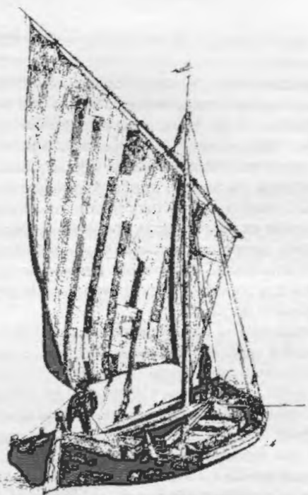
Barcheto - da "Barche tradizionali del golfo di Venezia", di Luigi Divari

Aver cura delle barche e delle strutture e rispettare le