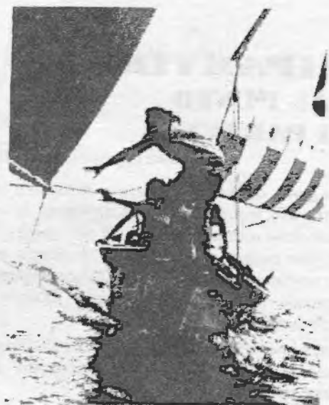
1986 - Circolo Casanova - Corso di fotografia in laguna - foto di R. Cappellieri.

L'aspetto più importante riguardava il rapporto fra servizio e dimensione associativa, questione che ha messo