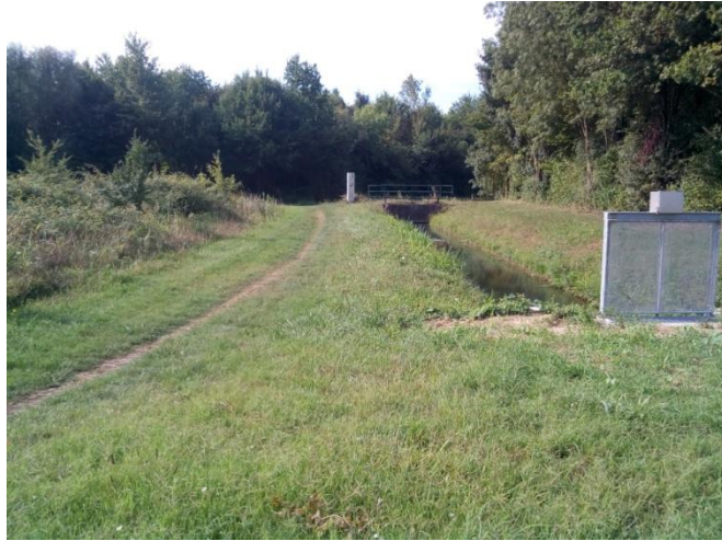
realizzato nel 1960 con l'alveo in cemento