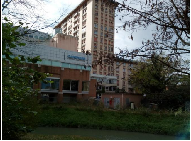
il cuore culturale di Mestre, davanti a cui corre una delle passerelle