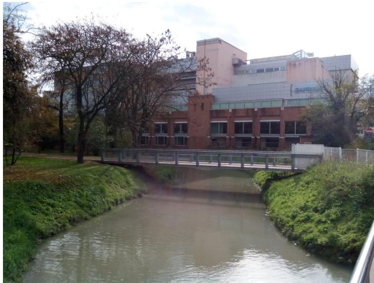
mentre un'altra entra addirittura direttamente nel complesso.