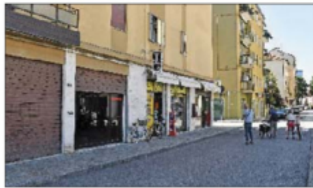
FURTO Disavventura notturna per un panettiere in via Corridoni

Panettiere, alle 2 di notte, si reca a lavorare: uno sconosciuto s'infiltra nella sua vettura, ne nasce una colluttazione