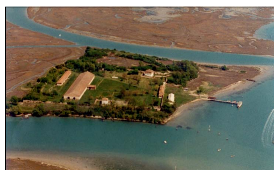
Isola del Lazzaretto Nuovo