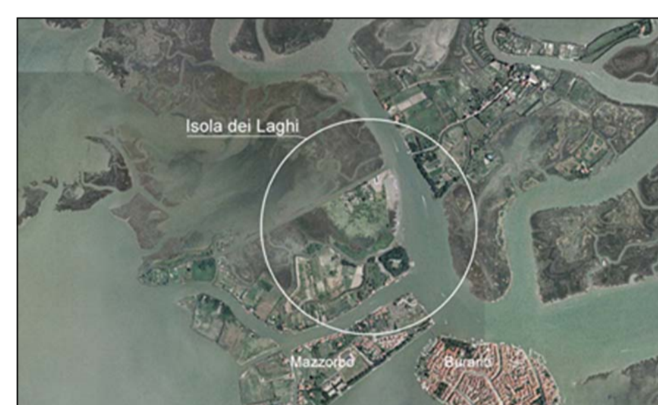
Isola dei Laghi