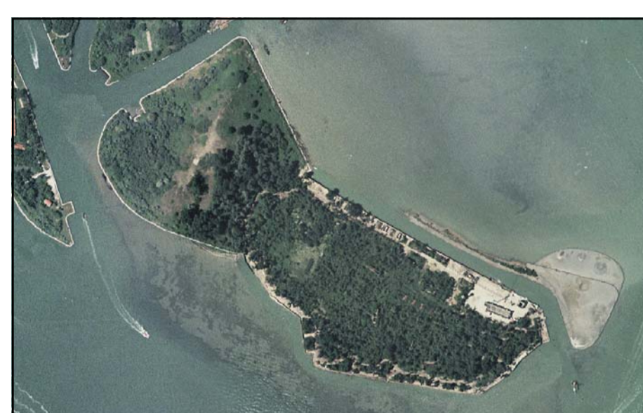
Isola della Certosa

I beni, per i quali la nuova Istituzione dovrà valutare le modalità e le condizioni per ottenerne l'affidamento, sono: