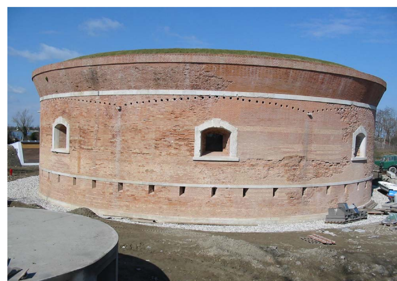
La Torre Massimiliana dopo il restauro architettonico effettuato dal Magistrato alle Acque

Compito principale dell'Istituzione "Parco della Laguna" è, inoltre, la valorizzazione ambientale e socioeconomica dell'area della Laguna Nord compresa nel perimetro proposto dall'Amministrazione comunale per la costituzione del PARCO DI INTERESSE LOCALE (ai sensi della L.R. 40/1984). Questo attraverso la definizione e la promozione di usi compatibili con la salvaguardia delle valenze naturalistiche, archeologiche, storiche e culturali dei luoghi.