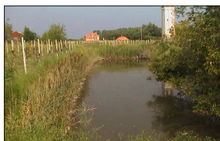
Tenuta Scarpa Volo