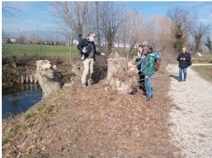
e vanno tagliati ogni cinque anni e si vede che la Lirosa dopo appena 300 metri è già rio.