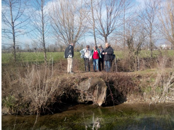
Un sguardo ai platani che hanno circa 250 anni