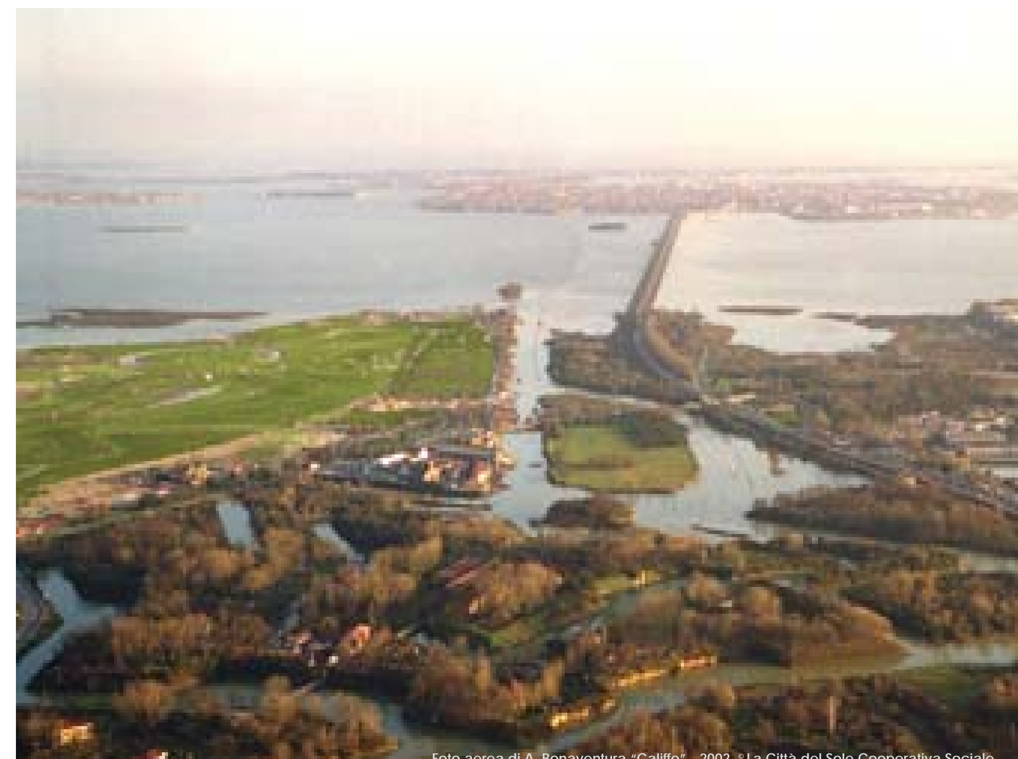
Foto aerea di A. Bonaventura "Califfo" - 2002. © La Città del Sole Cooperativa Sociale