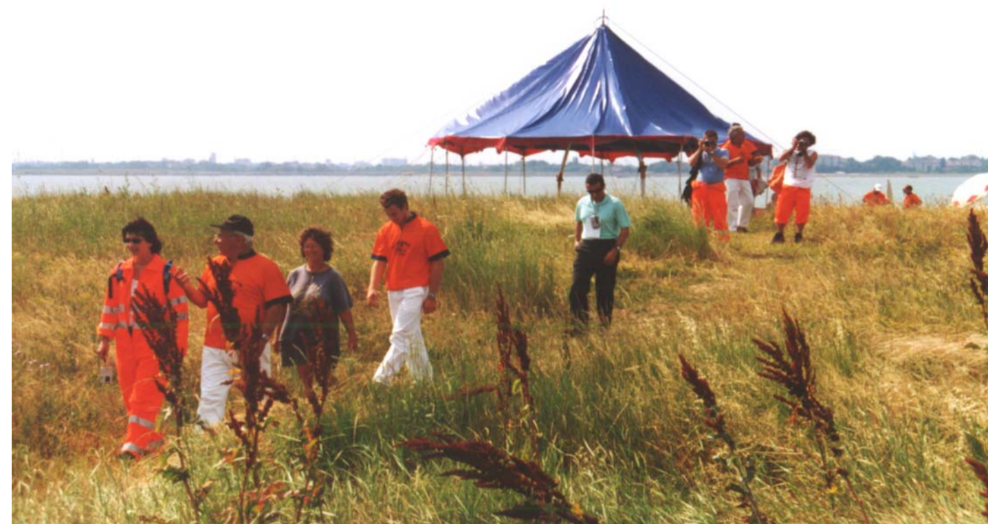
Visita all'isola di Campalto di artisti, amministratori e politici del 16 giugno 2001. In basso: incontro fra studenti canoisti italiani e spagnoli nell'ambito del progetto comunitario Erasmus

Il "Parco acqueo urbano" di San Giuliano, a est del Ponte della Libertà, fa parte di un contesto anfibo di altissimo pregio, pressoché sconosciuto dalla maggior parte dei cittadini. Il complesso a "stella" di Forte Marghera fa parte integrante del Piano Guida del "Parco di San Giuliano".