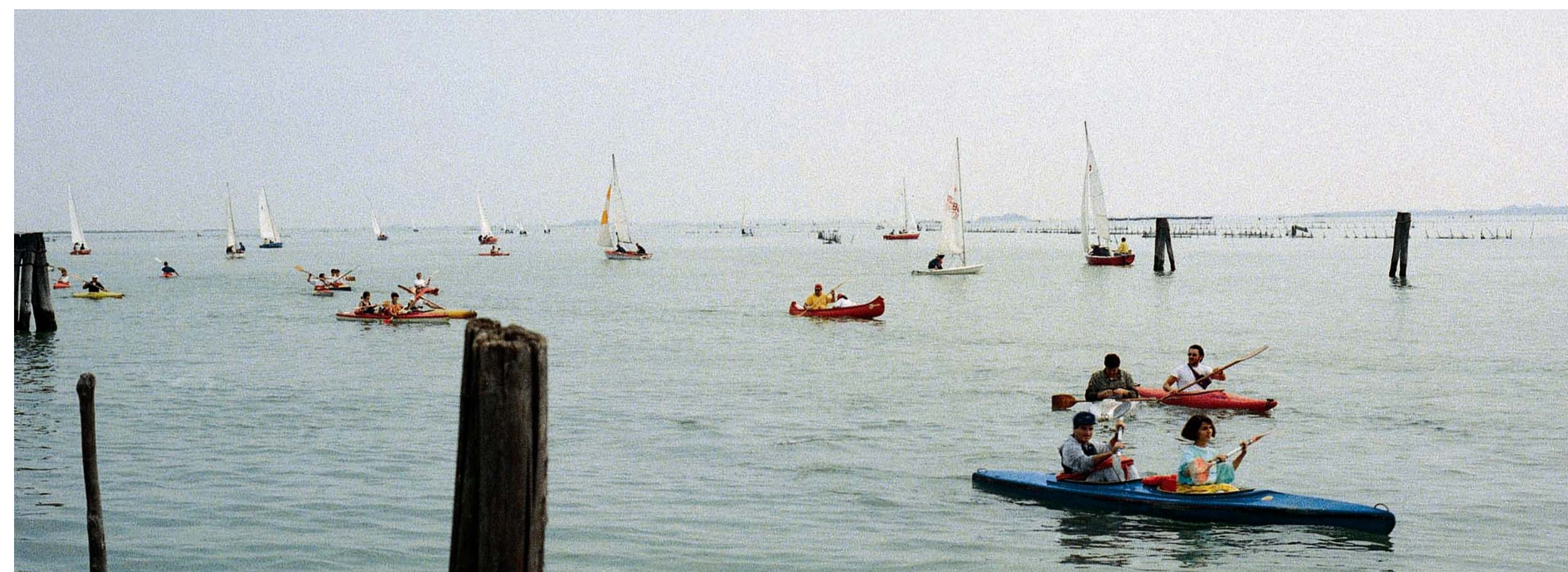
La nautica naturale nel "parco acqueo urbano" di San Giuliano, appartiene al paesaggio di ogni giorno

Nella primavera del 2004 il Magistrato alle Acque di Venezia, in sintonia con il Comune di Venezia, ha realizzato nell'isola di Campalto un pontile d'attracco ed eseguito la pulizia dal pietrame del fondale circostante. L'opera costituisce la prima realizzazione specifica per la nautica naturale , e rappresenta un'importante attestazione per quanti, dai ragazzi agli anziani, in canoa, a remi o a vela, si trovino a navigare nel parco acqueo urbano .