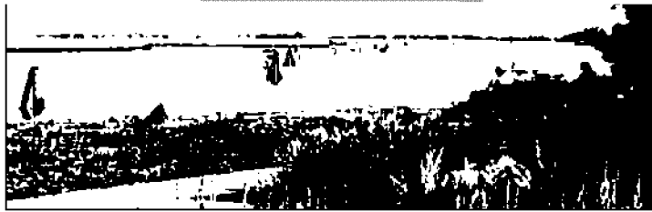
EVENTO Imbarcazioni piccole e medie andranno a San Giuliano