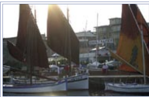
Raduno di barche storiche

"Fare corsi che avvicinano giovani ed adulti al vecchio modo di andare per mare, promuovere e diffondere la ricerca storica e la conoscenza della navigazione a vela e del lavoro delle marinerie, questo è l'obiettivo dell'associazione culturale che insegna anche ad armare ed